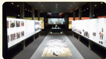
相馬市歴史資料収蔵館・郷土蔵 相馬市中村字北町 51-1