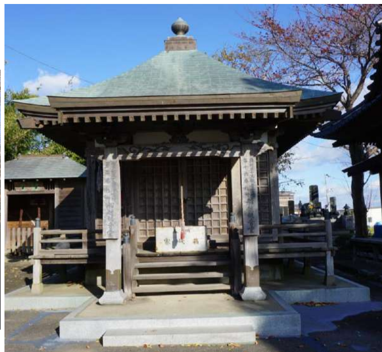
左：船越観音 右：夕顔観音